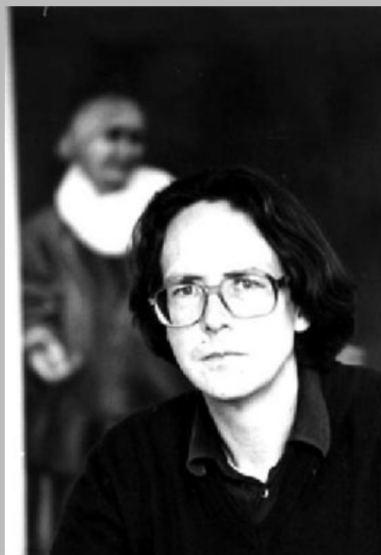
Peter Handke.