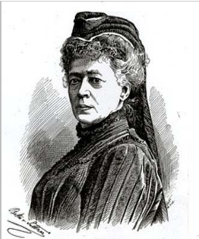
Bertha von Suttner, 1905.

Nøgletitel: Småskrifter fra CØNK (Online) ISSN: 1600-9517