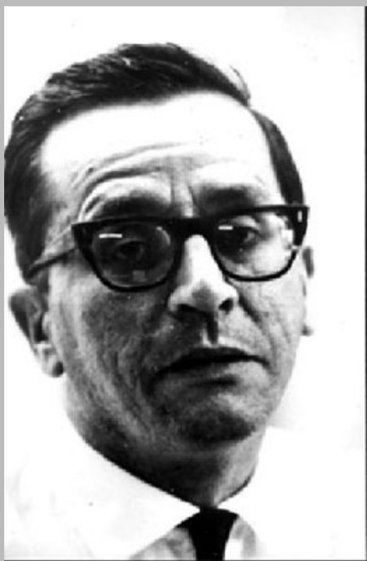
Johannes Mario Simmel.