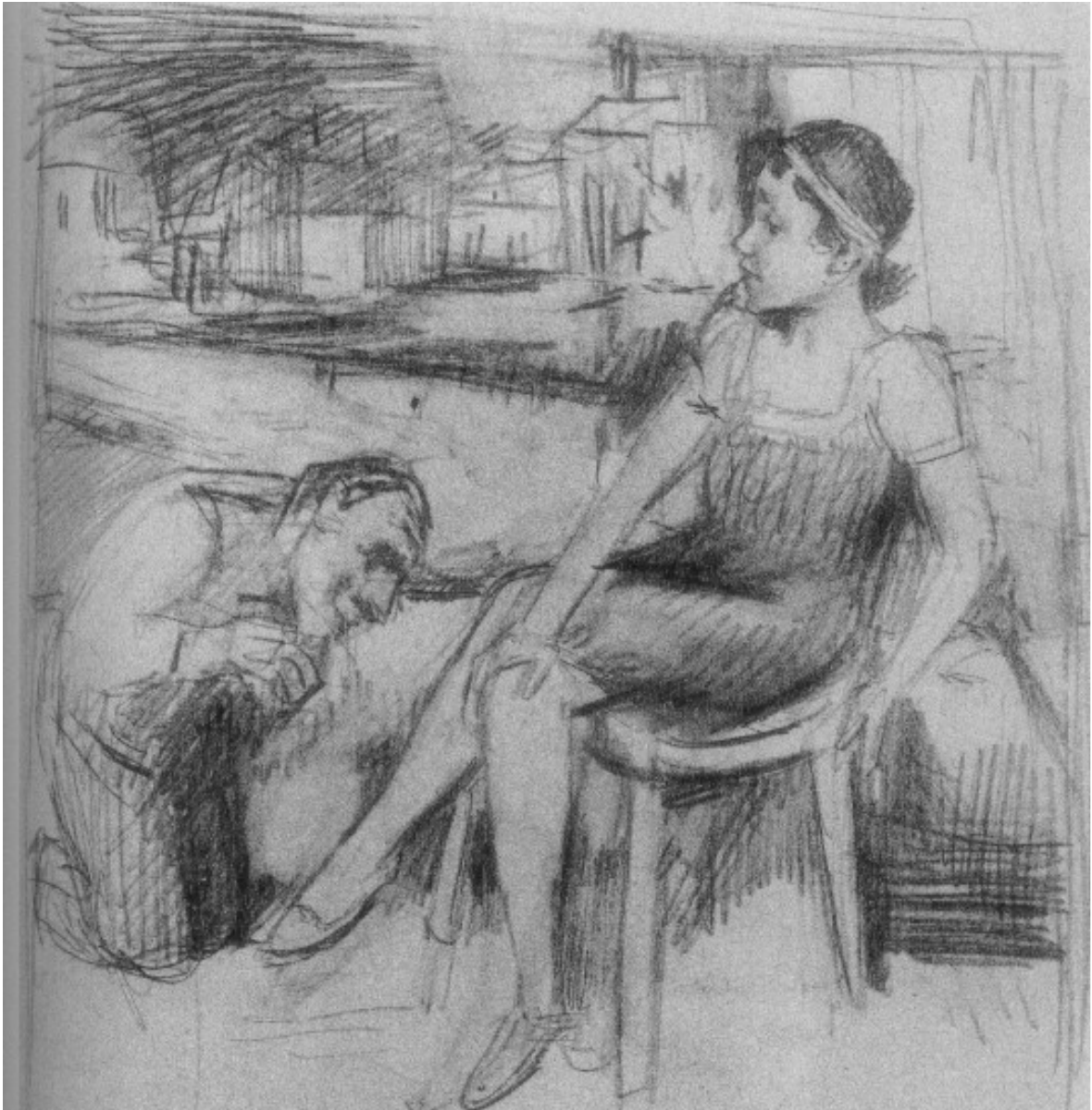
Bruno Schulz (1892-1942): Frau auf Stuhl und knieender Mann davor mit Stadthintergrund", ca. 1934. Bleistift auf Papier.

ten. Ob das nie enden will, auch in einer so verhältnismäßig offenen und aufgeklärten Gesellschaft wie der unseren? Daher verstehe ich sehr gut, dass