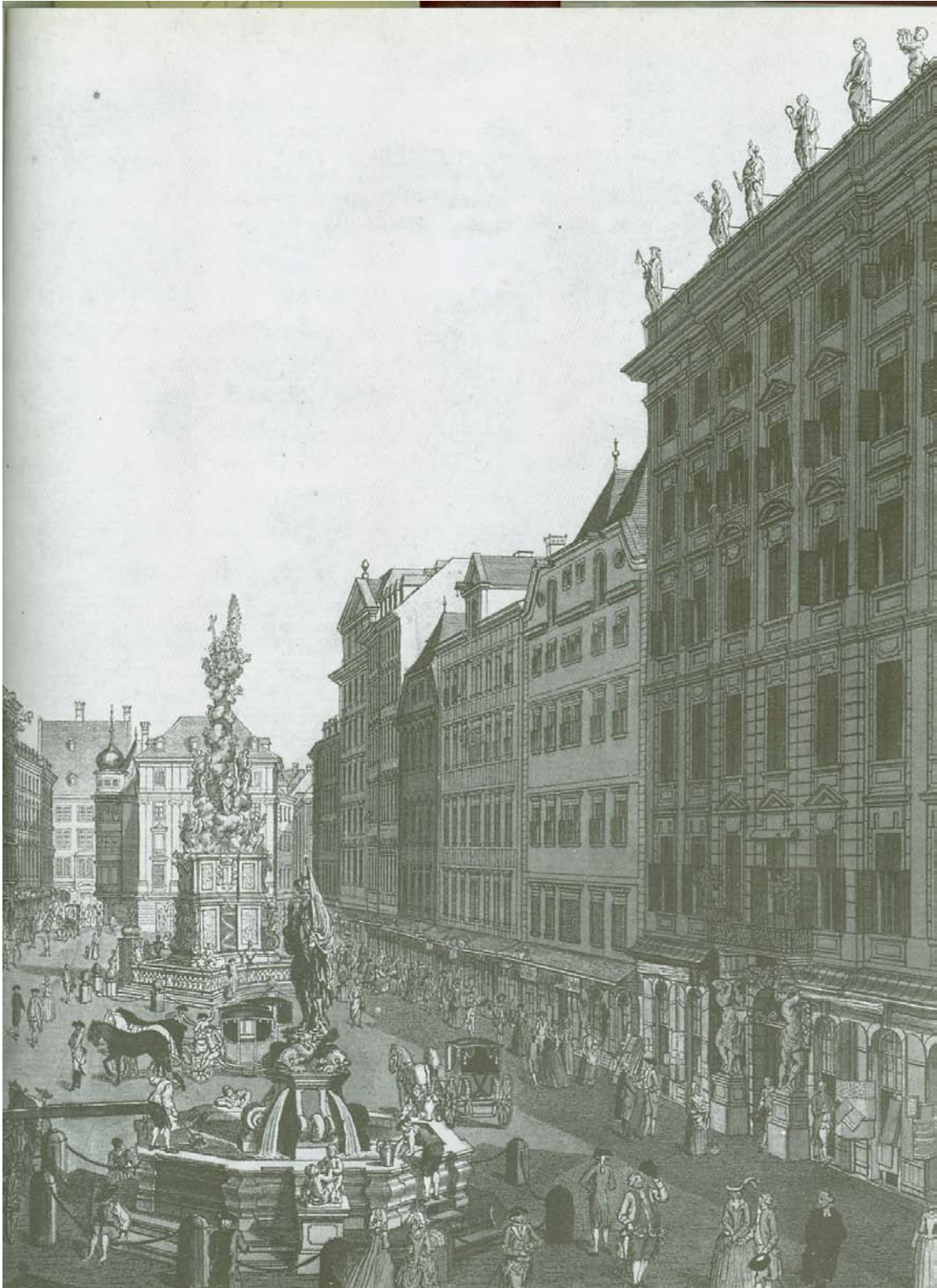
Der Graben (Kobberstik af Carl Schütz, 1781 [udsnit])