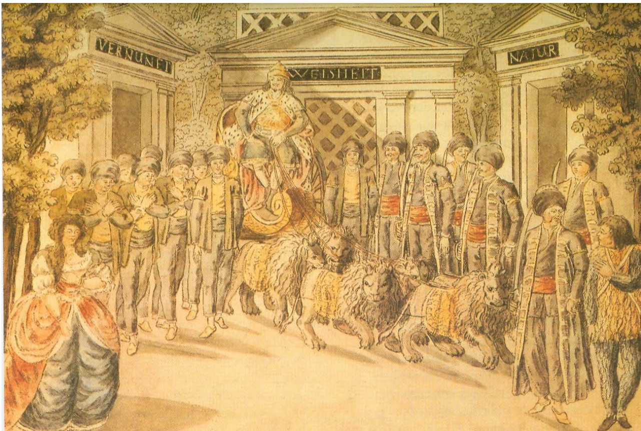
Die Zauberflöte, Sarastros indtog. Kobberstik af Peter Schaffer efter Schkaneders iscenesættelse ved "Theater auf der Wieden", 1795

efter lang tid som ejer af et vandreteater overtog ledelsen i 1789. Teatret var i det hele taget et unikum, en imponerende stor bygning, fremstillet af billigt materiale. Det kunne rumme 1000 mennesker. Bygningen va