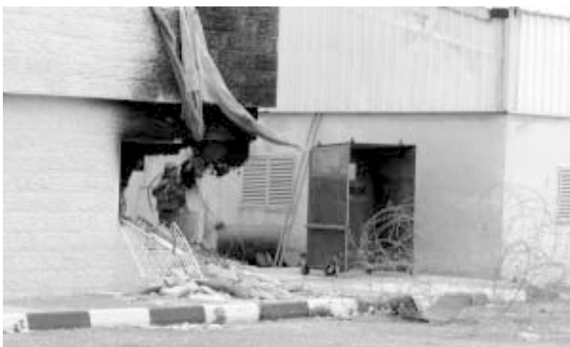
Når der var diplomater i huset benyttede vi vesterlændinge chancen til at se solen. Men altid skulle hyggen spoleres af et skarpladt våben med kikkertsigte. Jeg lærte aldrig helt at vænne mig til de mange våben – hverken indenfor eller udenfor bygningen.