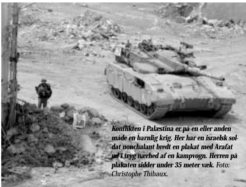
Konflikten i Palæstina er på en eller anden måde en barnlig krig. Her har en israelsk sol- dat nonchalant bredt en plakat med Arafat ud i tryk nærhed af en kampvogn. Herren på plakaten sidder under 35 meter væk.

Med hænderne strakte over hovedet fortsætter jeg over den store parkeringsplads og priser mig lykkelig over, at der imellem mig og kampvognen er to rækker af ci- vile biler. Hele tiden skal jeg minde mig selv om, at jeg ikke må løbe. Det kan gøre soldaterne nervøse og få dem til at skyde uagtsomt. Derfor bliver det i hurtig gang, at jeg fortsætter frem mod en barrikaderet ind- gang langt fremme. Alt omkring mig er kaos og helt uoverskueligt. Chokgranaterne detonerer i et væk og skuddene smælder på denne spøgelsesplads med smad- rede biler, opdænget jord og ruindynger, hvorend man