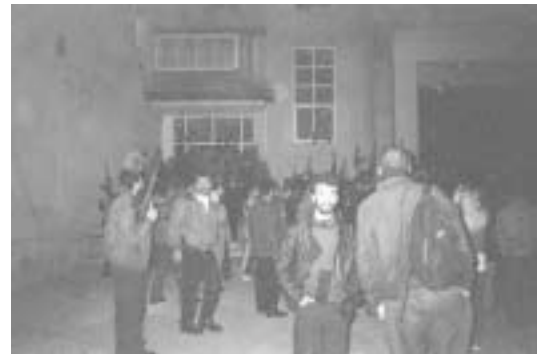
Mit livs mest mindeværdige 1. maj. Denne ellers så »højhellige« dag blev om natten ved 01-tiden vores befrielse. Stridsspørgsmålet, fem PFLP-fanger, blev overført til Jeriko og israelerne trak sig ud. Selvom det ser sådan ud, bliver der altså ikke afgivet et eneste skud fra de frihedsberusede palæstinensiske sikkerhedsstyrker.