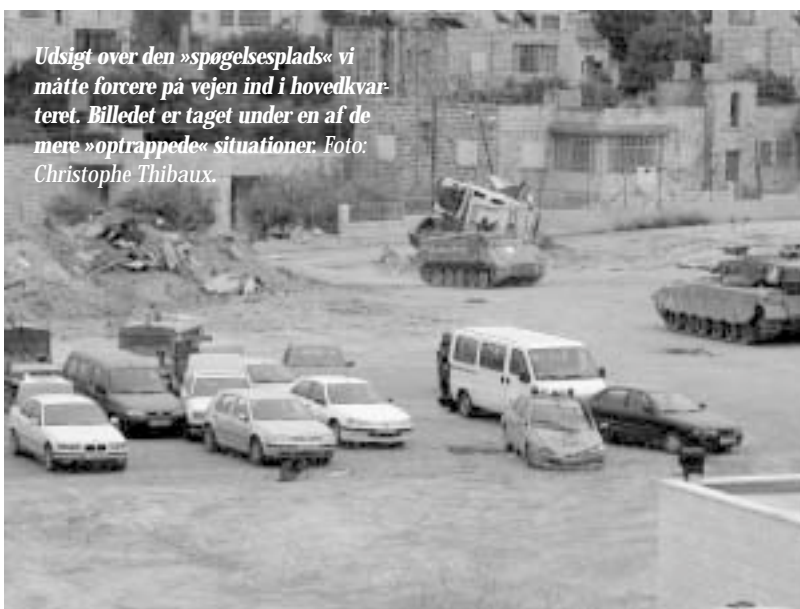
Udsigt over den »spøgelsesplads« vi måtte forcere på vejen ind i hovedkvar- teret. Billedet er taget under en af de mere »optrappede« situationer.