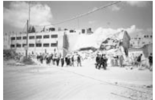
Ikke Irak - men Palæstina. Del af yderkompleksets mange ruiner. Her strømmer interesserede civile til efter at de israelske tropper har trukket sig tilbage.