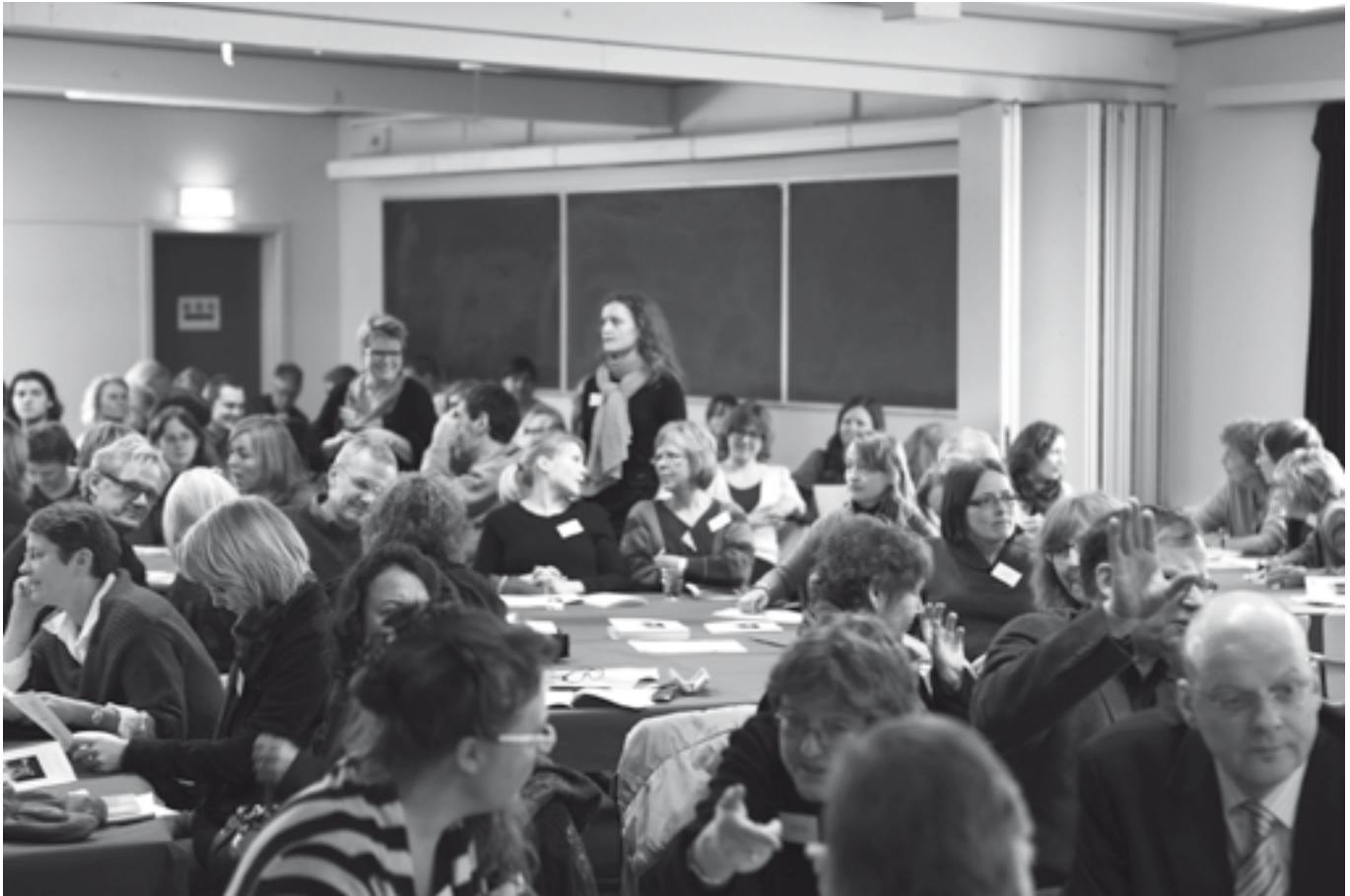
Diskussions- og spørgelystne deltagere til csufs åbningsseminar.

og erhvervsliv. "Centeret styrker RUC som regionalt universitet og kan bidrage til udviklingen af den sunde region Sjælland. Region Sjælland står med store udfordringer foran sig, men har samtidig væsentlige erfaringer fra sundhedsfremmeindsatser."