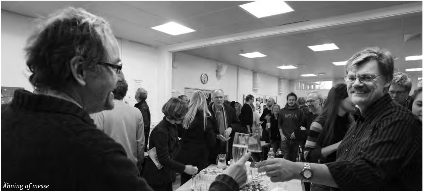
Åbning af messe

til at besigtige de mange spændende projekter, hvoraf cyklen blot var et.