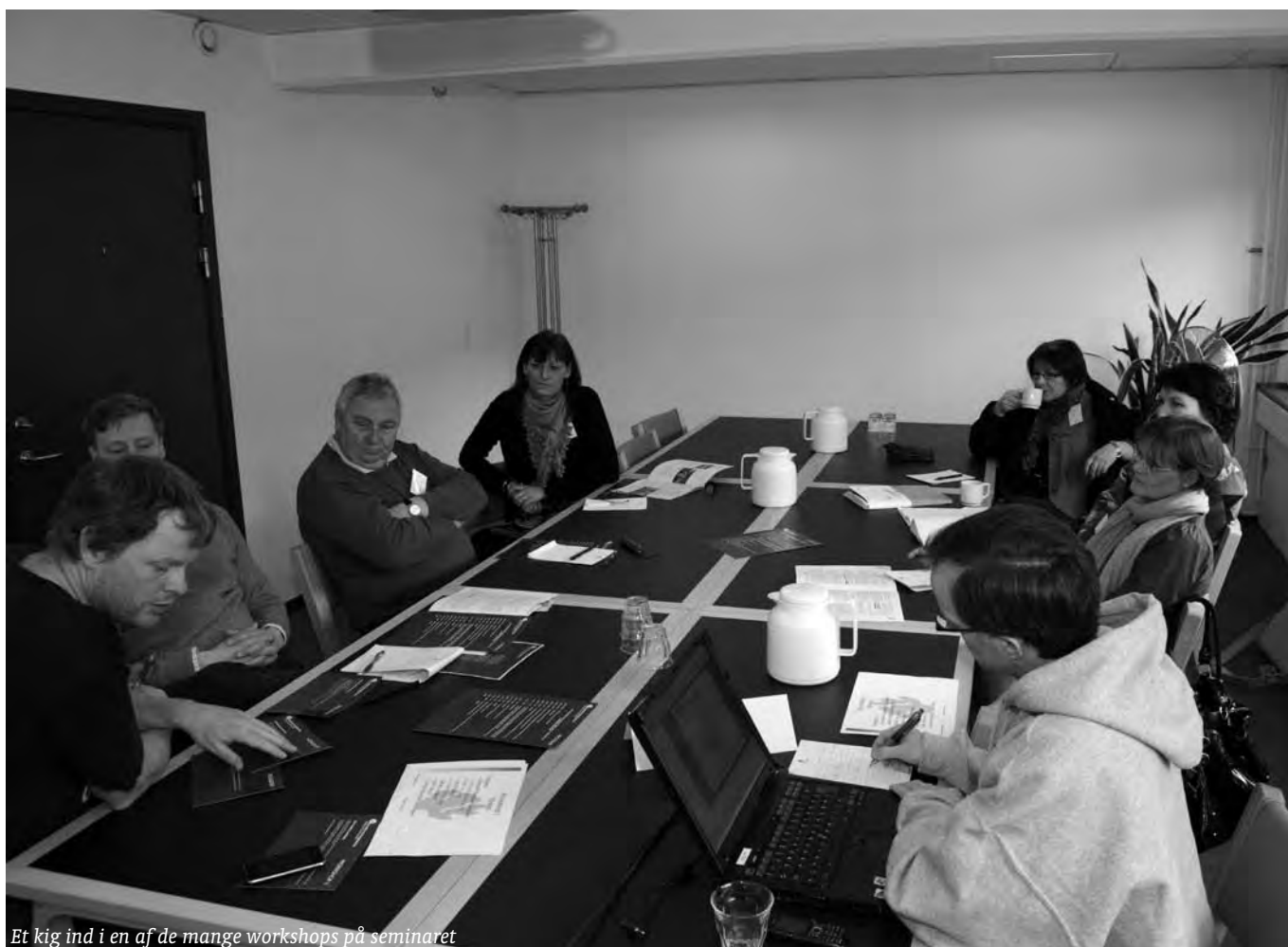
Et kig ind i en af de mange workshops på seminaret