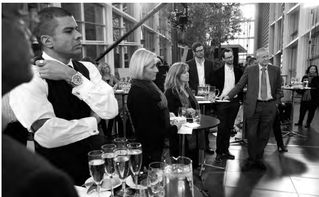
Åbning af Danskernes Akademi i Indre Gade i DR byen.

tetet, men som altid har været nysgerrige på akademisk viden, og for dem, der allerede har et lystbetonet forhold til spændende forelæsnings om alt fra filosofi til ernæring: Danskernes Akademi sendes på DR2 mandag-torsdag kl. 14 - 16, og har sit eget website på dr.dk/akademi . Hvert tv-program har sit eget tema, som behandles gennem forelæsnings med nogle af de mest vidende forskere inden for emnet, fra såvel universiteterne som landets øvrige forskningsmiljøer, kombineret med samtaler, interviews samt danske og udenlandske dokumentarer, som supplerer og perspektiverer dagens emne. På dr.dk/akademi er det muligt at hente de forelæsnings, der har været sendt på tv, som podcast.