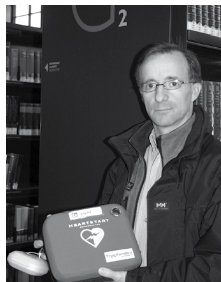
Hjertestarteren ligger i en lille æske, der skal åbnes. Så snart du åbner den, begynder en stemme at instruere dig i, hvad du skal foretage dig.

Se en instruktionsvideo på hjertestarter.dk