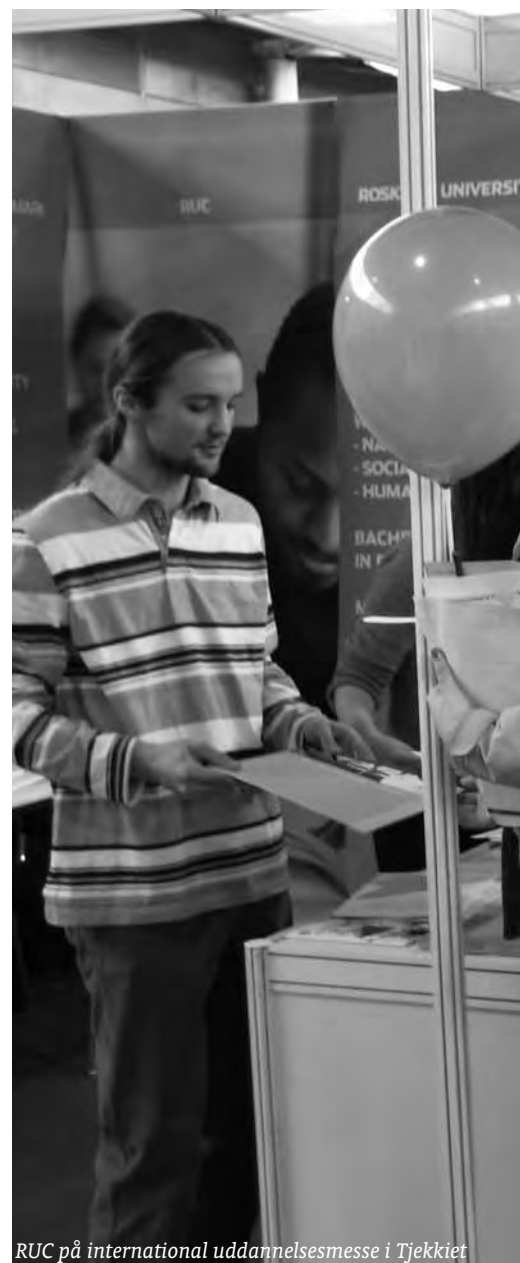
RUC på international uddannelsesmesse i Tjekkiet

Samtidig stiller studieophold på egen hånd nogle andre krav til dig, idet du skal være mere