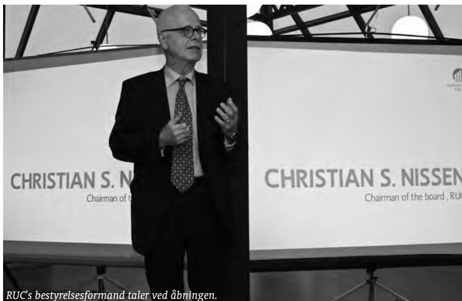
RUC's bestyrelsesformand taler ved åbningen.