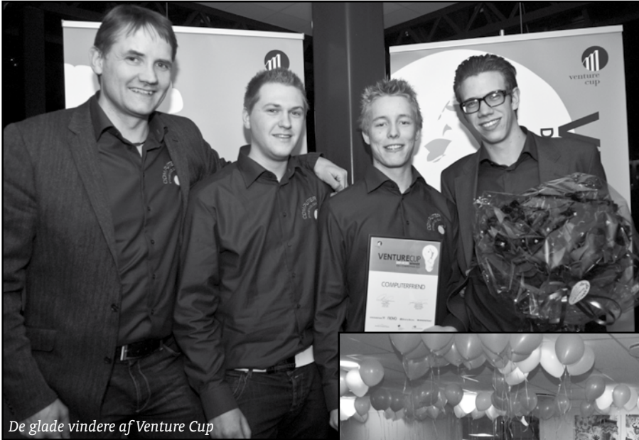
De glade vindere af Venture Cup