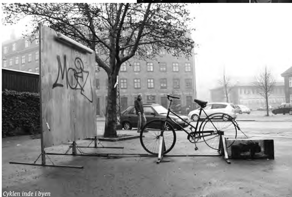
Cyklen inde i byen