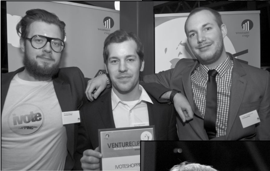
Publikums favorit: vindere af sms-konkurrencen