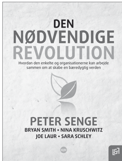
Den nødvendige revolution Hvordan den enkelte og organisationerne kan arbe- jde sammen om at skabe en bæredygtig verden. Af Peter Senge