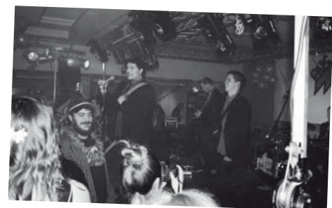
▲ MGP - PMS : Gruppen PMS tager en pause, mens publikum får pusten.