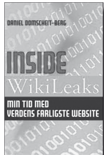
Inside WikiLeaks Min tid med verdens farligste webside Af Daniel Domscheit-Berg