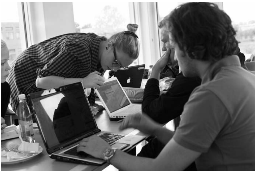
Den traditionelle projektform skaber ofte en lukket gruppestruktur, mens større klynger giver en struktur, hvor de studerende bliver mere involverede i hinandens arbejde, mener Jeppe Z. Ajslev.

- Den traditionelle projektform skaber ofte en lukket gruppestruktur, men de store klynger giver en mere integreret netværksstruktur, hvor de studerende bliver mere involverede i hinandens arbejde, siger han.