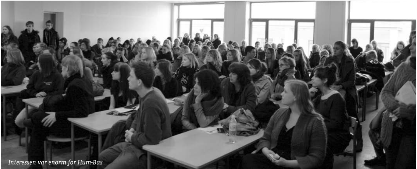
Interessen var enorm for Hum-Bas