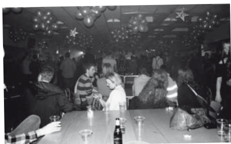
▲ MGP - : MGP bød op til fest og farver i RUCs kantine – bogstaveligt talt.