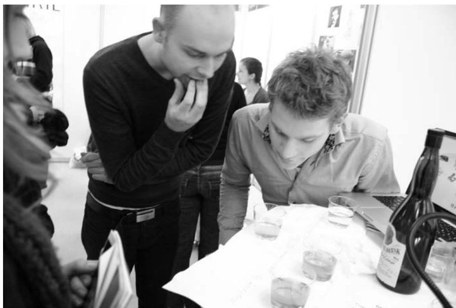
Miljøbiologi inviterede til forsøg med Gammel Dansk