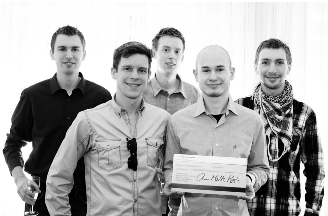
Gruppen på Humanistisk-Teknologisk Basisstudium fik overrakt prisen på 10.000 kroner onsdag den 16. marts.