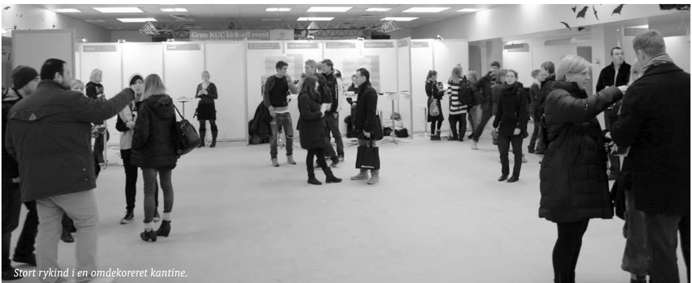
Stort rykind i en omdekoreret kantine.

selv er overbygningsstuderende på Virksomhedsstudier, på, at det er kombinationen af business og bløde værdier, der tiltrækker.