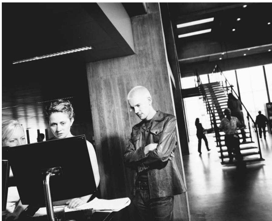
Man skal tilbage til 1993 for at finde en arbejdsløshed blandt unge, på samme niveau som i dag.

Man skal 17 år tilbage for at finde en højere arbejdsløshed blandt unge. Særligt mændene er hårdt ramt. Det fastslår en ny opgørelse fra AE-rådet