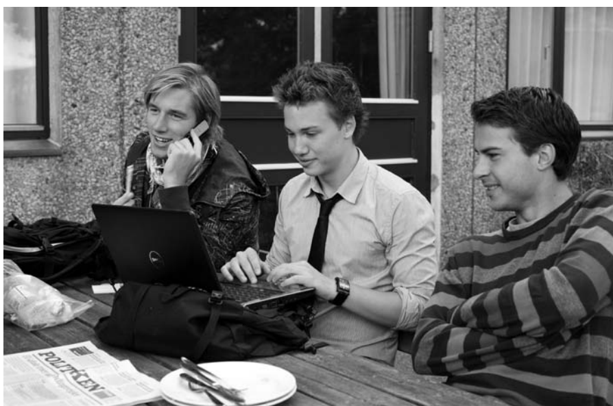
Man skal tænke grundigt over, hvad man formidler, og hvorfor man formidler det, når man søger job

Det er næppe nogen overraskelse, at noget af det vigtigste, når du søger job, er at fortælle hvad du kan. "Og her er det vigtigt at komme med konkrete eksempler. Det kan være fra stu-