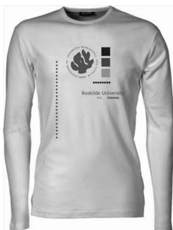
Langærmet herre T-shirt 155 kr