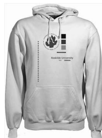
Hættetrøje 230 kr

Vi tager forbehold for prisændringer og trykfejl