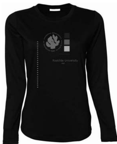
Langærmet dame T-shirt 155 kr