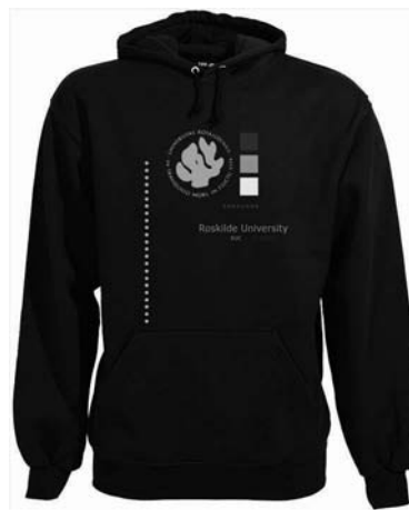
Hættetrøje 230 kr