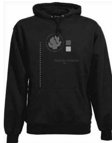
Hættetrøje 230 kr