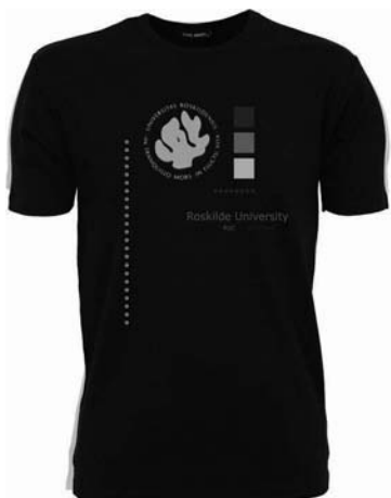
T-shirt 142 kr