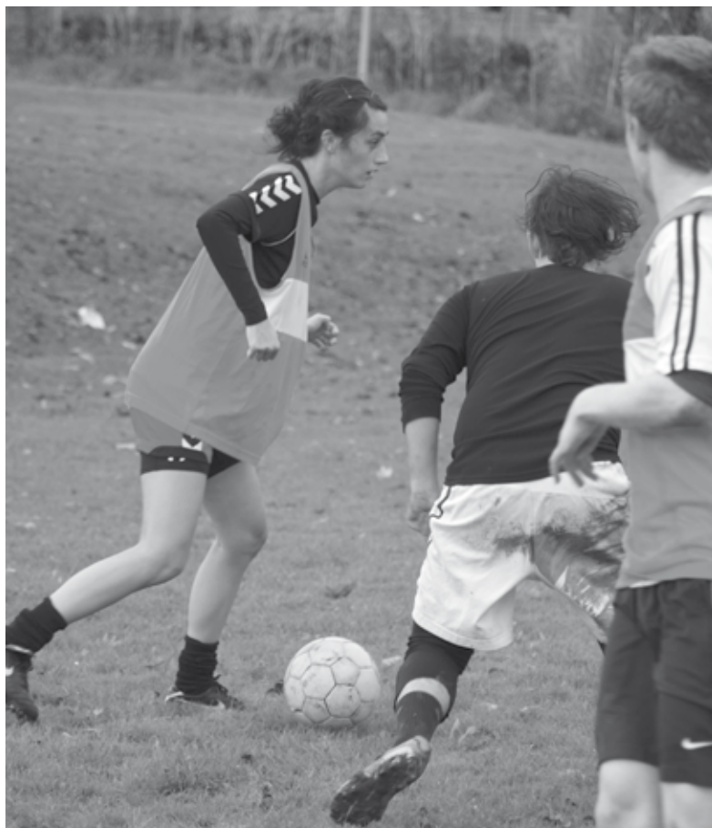
Hvordan kunne man gøre RUC til et sportsligt Utopia?