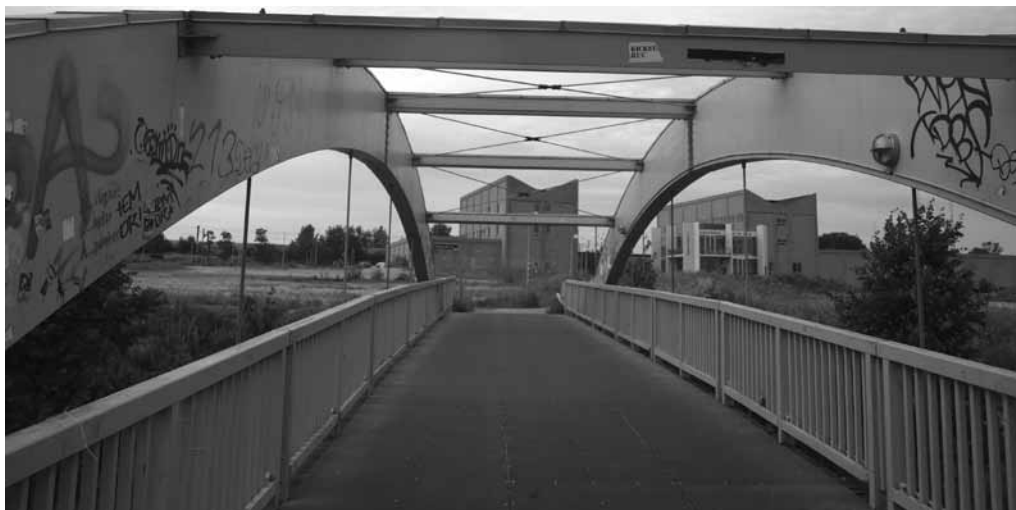
Hist hvor vejen slår en bugt, er der opslået en bro, båret af graffiti.