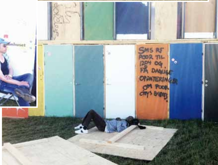
Der var også plads til at tage sig en lur i årets Poor City på Roskilde Festival.

Gennem events og aktiviteter skaber Poor City opmærksomhed omkring situationen for unge asylansøgere i Norden. Man kunne blandt andet opleve musikalske optrædener og deltage i debatter om asyl - og blive klippet af asylansøgere i 'Barbershoppen' (billedet ovenfor).