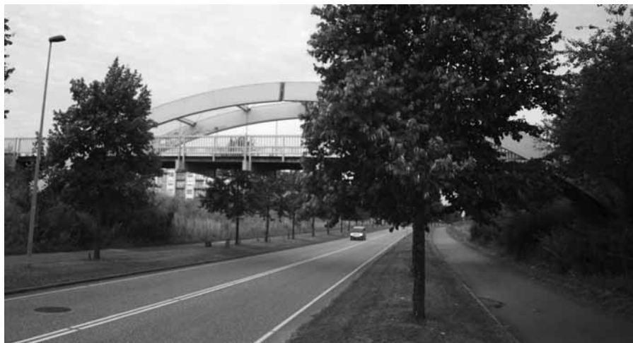
En nødvendighed for de gående, men godt mørnet i kanten for en stående.

"Den usynlige øjebæ". Kunne det være titlen på min monsterfilm? Jeg tænker tanken, som jeg overvejer hvad der egentlig er ønskværdige egenskaber hos en bro. "Sikkerhed", er